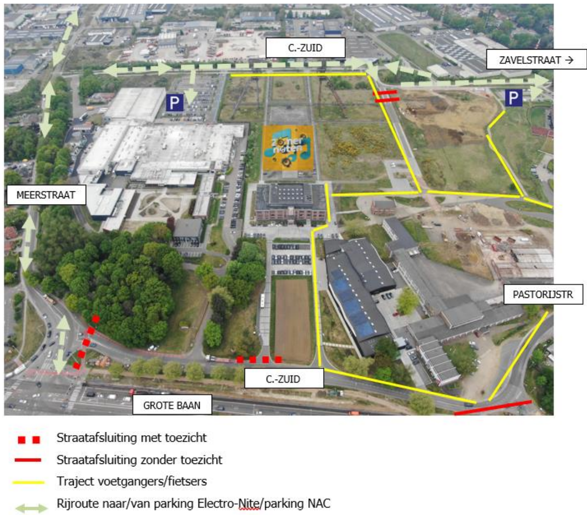
Figuur 3 – verkeersafwikkeling zuid